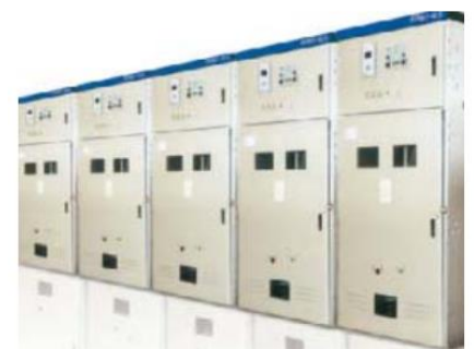
KYN61-40.5 型铠装移开式交流金属封闭开关设备