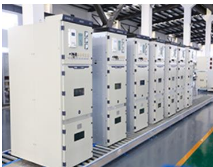
KYN28A-12 (Z)型户内交流金属铠装中置式开关设备

中天电气年产值 2 个亿，公司主营配电开关设备，包括高低压开关成套设备（开关柜），环网柜，中压气体绝缘开关柜、配网智能化设备、节能环保电气设备等；公司面向客户：国家电网、南方电网、内蒙古电网、各大发电集团、新能源、通信、轨道交通、政府工程、工矿企业等领域； 人才结构主要以电气类为主。