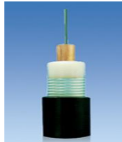
中心管式双层铠装馈电结构