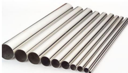
不锈钢管系列产品