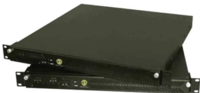
分布式光纤测温系统（DTS）

公司专业从事电力特种光缆（OPGW、OPPC）、不锈钢管光纤单元、油井光缆系列、工业用精密不锈钢管等产品的设计、生产与销售，年产值 8 个亿。公司主要客户为国家电网和南方电网。涉及相关专业为： 机械及电气自动化、金属材料、电力通信、石油工程、油田测井。