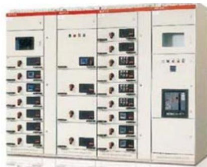
ZTMNSX 型低压轴出式开关设备