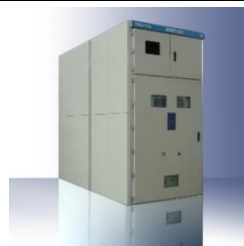
高低压成套开关设备